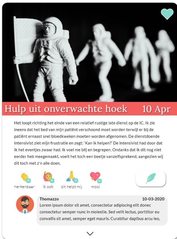
Een aantal voorbeelden van berichten op Masks Off.

Masks Off is een platform met verhalen gemaakt voor en door verpleegkundigen. Het biedt inspirerende, informatieve en geruststellende verhalen in een taal en toon die verpleegkundigen aanspreekt. Verpleegkundigen kunnen hierop reageren en hun eigen ervaringen delen. Dit helpt hen om stil te staan bij gebeurtenissen, zich op nieuwe gebeurtenissen voor te bereiden, te weten dat ze niet de enige zijn die hiermee te maken hebben en ze kunnen elkaar desgewenst ondersteunen.. Een cruciaal kenmerk van dit platform is het creëren van een veilige en oordeelvrije omgeving. Er wordt gebruik gemaakt van storytelling elementen waaronder aliases en avatars, voorbeeldverhalen en communicatie-tools. Iedereen is anoniem en gebruikers worden begeleid in het delen van hun eigen verhaal.